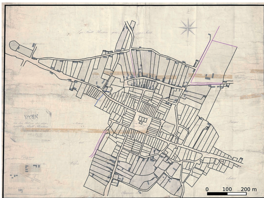
Ryc. 5. Wizualizacja tematyczna 2 Fig. 5. Thematic visualization 2