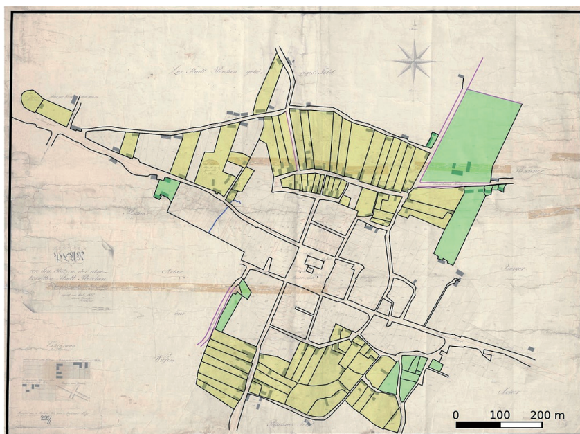
Ryc. 6. Wizualizacja tematyczna 3 Fig. 6. Thematic visualization 3