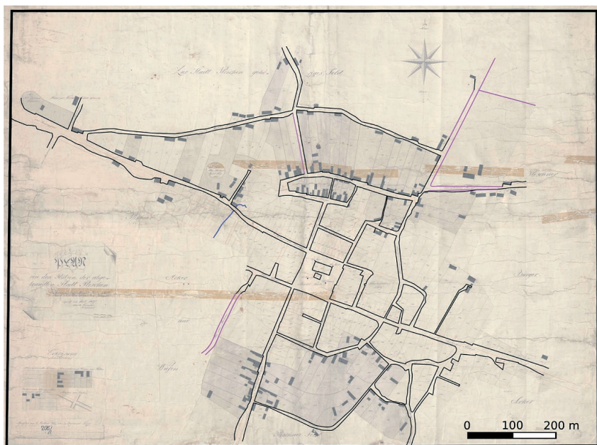
Ryc. 4. Wizualizacja tematyczna 1