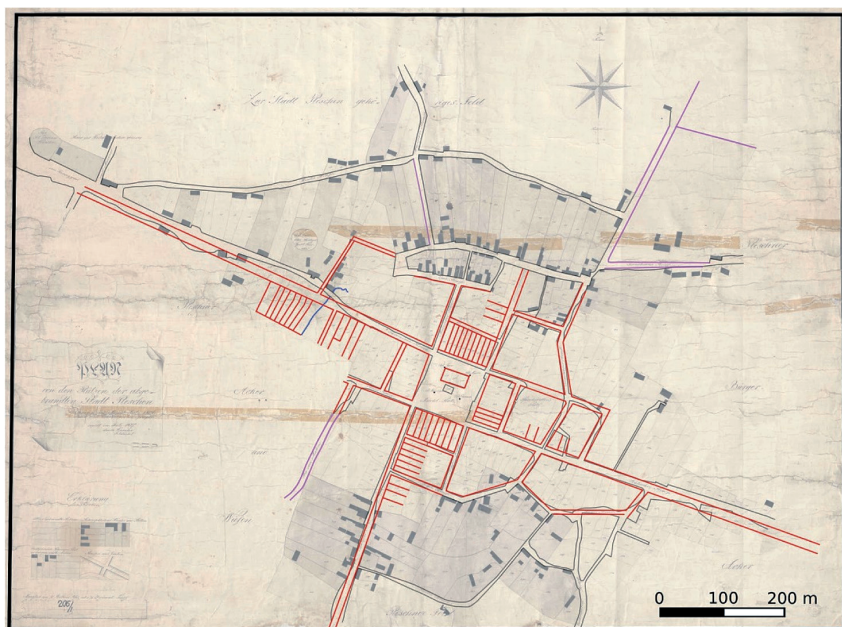
Ryc. 7. Wizualizacja tematyczna 4