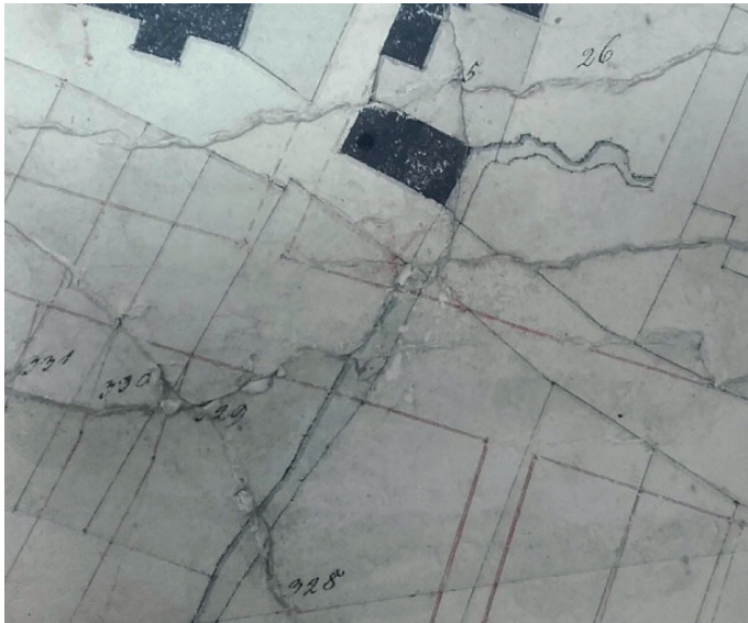
Ryc. 2. Wody powierzchniowe

Na planie utrwalono sygnaturę liniową w kolorze czerwonym (pojedyncza linia ciągła). Odcień zastosowanej czerwieni był mocniejszy niż w przypadku wcześniej opisywanych wydzieleni legendy. Dzięki temu rysunek stał się wyraźny i interpretacja rozkładu przestrzennego tak zapisanych form była