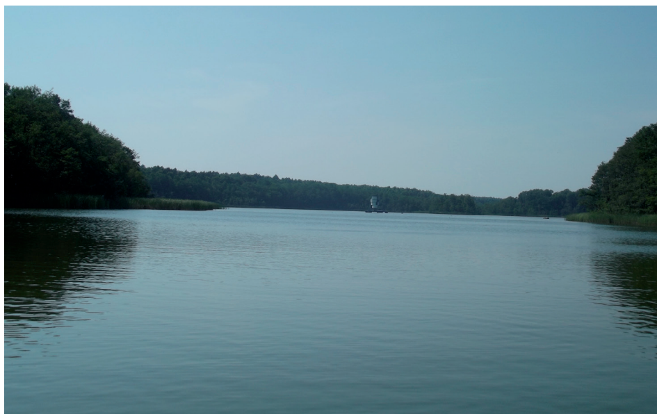
Fot. 1. Jezioro Strzeszyńskie – południowa część zbiornika

Brzegi jeziora porastają rozległe szuwary z dominacją trzciny pospolitej ( Phragmites australis ), pałki szerokolistnej ( Typha latifolia ) i wąskolistnej ( Typha angustifolia ). Zwłaszcza przy północno-zachodnim brzegu agregacje tworzy kłoc wiechowata ( Cladium mariscus ) (jedyne stanowisko w Poznaniu). W płytkiej zatoce północnej zbiorowiska tworzą grzybienie białe ( Nymphaea alba ). Z rzadziej spotykanych gatunków w wodach jeziora stwierdzono rogatka krótkoszyjkowego ( Ceratophyllum submersum ) (Zgrabczyńska 2008). W strefach płycizn przez wiele lat notowano dobrze rozwinięte płaty roślinności zanurzonej. W roku 2005 największy udział w fitolitoralu miała tworząca rozległe łąki ramienica omszona ( Chara tomentosa L.). W płytszych partiach jeziora