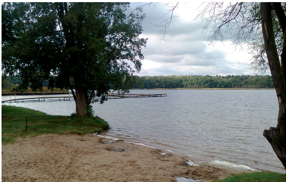
Fot. 2. Przekształcony przez człowieka wschodni brzeg Jeziora Strzeszyńskiego z piaszczysto-trawiastą plażą (fot. A. Kaźmierska)

Wartościowy obszar pod względem przyrodniczym i dogodna lokalizacja sprawiają, iż Jezioro Strzeszyńskie należy do zbiorników atrakcyjnych dla mieszkańców Poznania i okolic pod względem rekreacyjnym (Świerk i in. 2010) (fot. 2). Jezioro cechuje się wodami eutroficznymi z letnią stratyfikacją